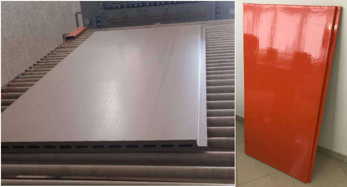
Slika 3. Velikoformatna terracotto ploča 130 x 60 x 3 cm za projekt u Moskvi

Teracotto ploče mogu biti neglazirane, glazirane ili engobirane. Neglazirane su u boji cigle ili odabirom sirovina i pigmenta boje slonokosti do antracit boje u desetak miješanih boja. Glazirane mogu biti gotovo u svim bojama slične RAL-bojama. Engobirane mogu biti u ograničenom broju nepastelnih boja.