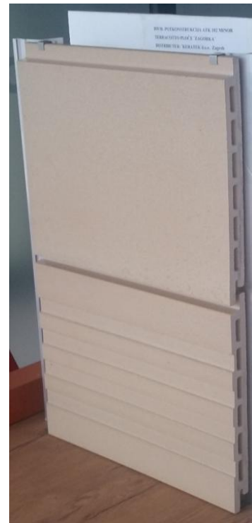
Slika 4. Terracotto ploče s nano glazurom

Nastao je novi proizvod za oblaganje fasada i može se kod "Zagorke" dobiti u dimenzijama dužine od 60 do 150 cm i širine 30 do 60 cm!