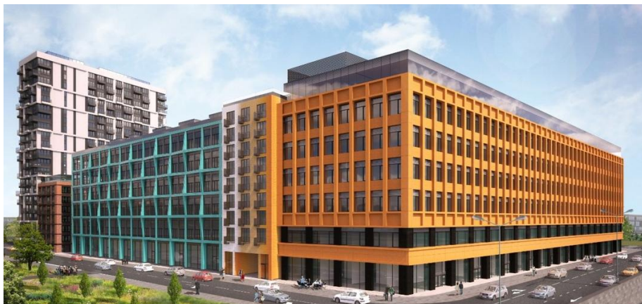
Slika 2. Projekt Suschewka, Moskva, izvodi se sa Zagorka glaziranim pločama

“Zagorka” je prije 2 godine počela sa proizvodnjom teracotto ploča dimenzija 120 x 30 cm, a danas proizvodi za projekat u Moskvi ploče 150 x 60 cm s vrlo atraktivnom glazurom u narančastoj boji.