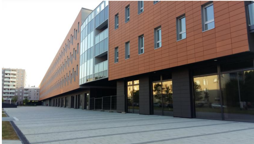
Slika 1. Vrbani III, terracotto ploče 90 x 30x 2 cm engobirano u crvenoj antracit boji

ZAGORKA TERRACOTTO PLOČE SA NANO POVRŠINSKOM ZAŠTITOM