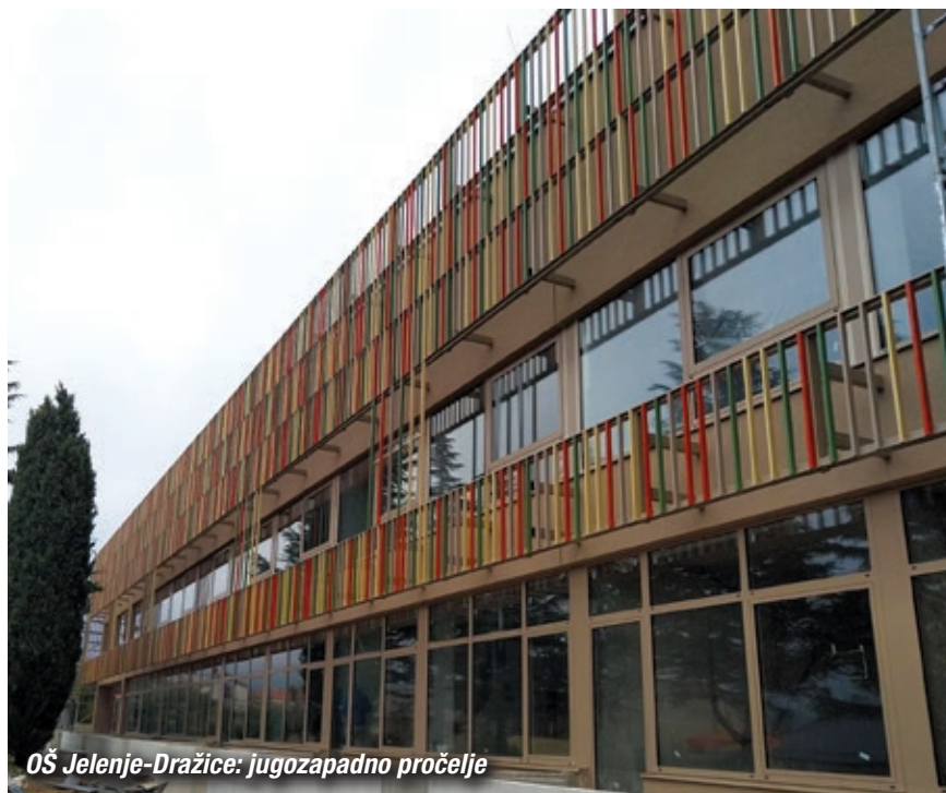
OŠ Jelenje-Dražice: jugozapadno pročelje

Za izradu statičkog proračuna morali smo na licu mjesta provjeriti nosivost zidova koji su bili 65% armiranobetonski, te 25% šuplji cigleni blokovi. Manji dio postojećeg objekta koji je rekonstruiran bio je izveden od siporeks blokova, te je dodatno ojačan kako bi se sidrenje čelične potkonstrukcije izvelo