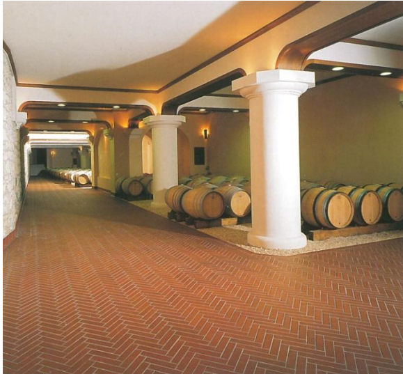
Vinski podrum, Italija – klinker pločice UNIROT

Terracotta keramičke pločice poznate i kao klinker pločice dimenzije 240 x 115 x10mm su crvene, boje cigle, otporne na kiseline, mraz i abraziju. Lako se čiste i ne upijaju te ne ostaju vinske mrlje. Svojom rustikalnom bojom se dobro uklapaju u rustikalni ambijent vinarija, vinoteka i punionica vina, i ispunjavaju sve tehničke i sanitarne zahtjeve.