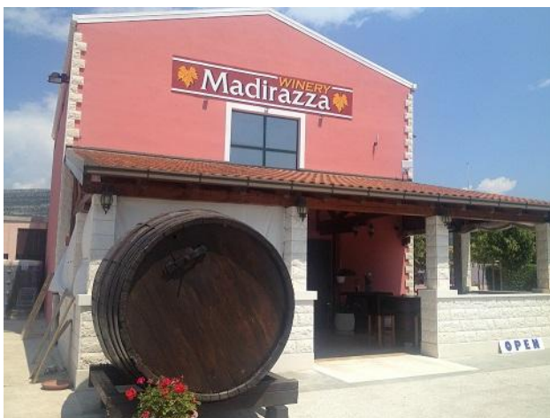
Vinarija 'Madirazza' Potomje