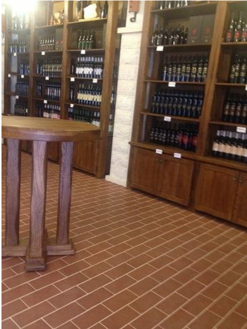
Vinoteka 'Madirazza' unirot klinker pločice

Da bi povećao ugled i plasman svog vina Madirazza je pred par godina uredio salon, izložbu vina sa podovima obloženim klinker pločicama UNIROT Njemačke firme Interbau Blink isporučenim od strane Keratek d.o.o. Zagreb.